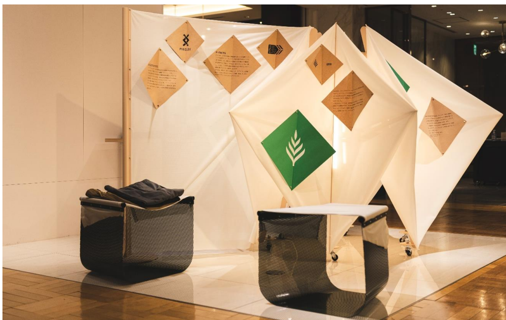
2月に開催した日本橋三越本店でのディスプレイ