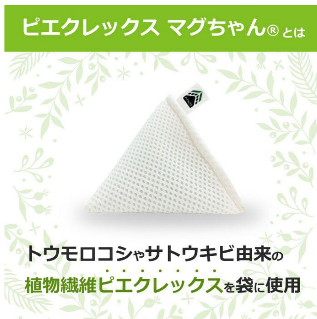
「ピエクレックス マグちゃん®」