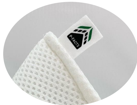
P-FACTS (ピーファクト) 対応 を示すピスネーム付き

※② P-FACTS : PIECLEX FAbrics Composting Technology Solution