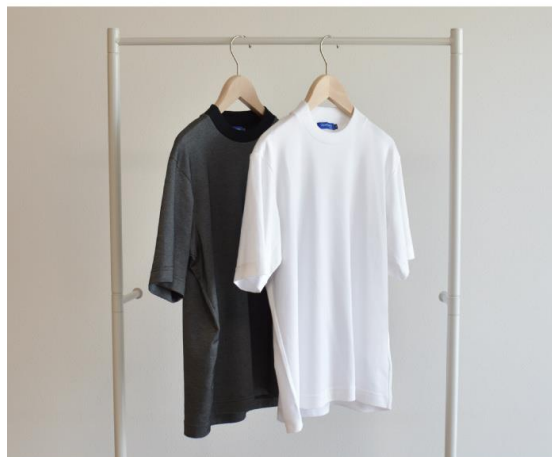
ブラック ホワイト