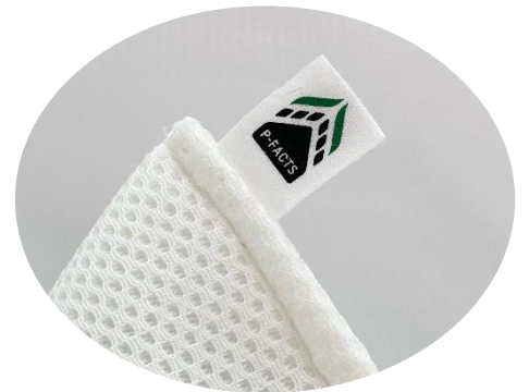
P-FACTS (ピーファクト) 対応を示すピスネーム付き

※② P-FACTS : PIECLEX FAbrics Composting Technology Solution